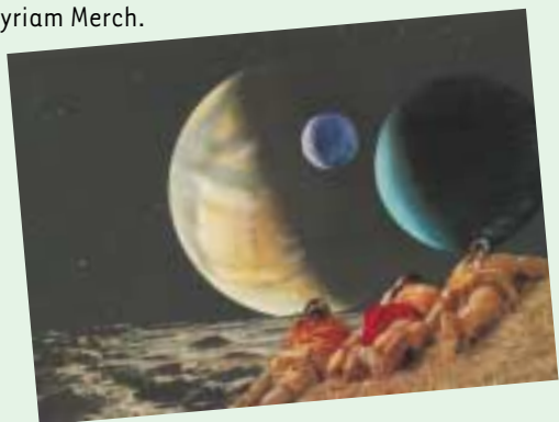
André Stas ©

Exposition d'art contemporain regroupant les œuvres de quatre artistes spadois : André Stas, Roland Breucker, le Capitaine Lonchamps et Myriam Merch.