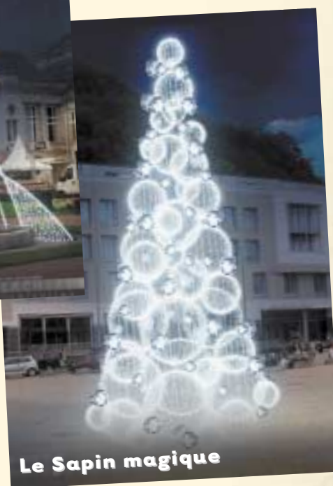
Le Sapin magique