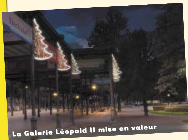
La Galerie Léopold II mise en valeur

Notre cité thermale est une destination touristique majeure. Au cœur du Pays des Sources et de l'Ardenne bleue, nous attirons de nombreux visiteurs. Nous le devons notamment à la relance du thermalisme, à une excellente infrastructure horeca (hôtels, restaurants et cafés), à l'organisation d'événements en tous genres, à un environnement plus qu'enviable, etc.