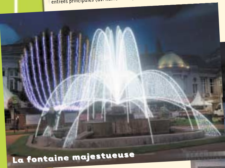
La fontaine majestueuse

Des décors transversaux permanents de voirie lumineux seront érigés aux trois entrées principales (av. Reine Astrid, bd des Anglais et rue de la Sauvenière).