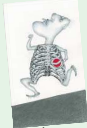
Roland Breucker ©