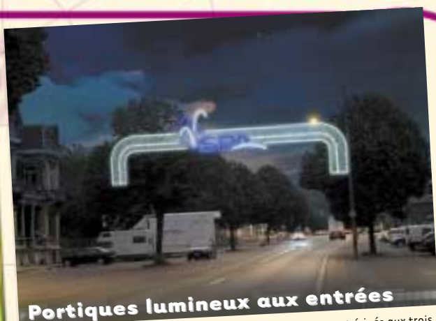
Portiques lumineux aux entrées

Des décors transversaux permanents de voirie lumineux seront érigés aux trois entrées principales (av. Reine Astrid, bd des Anglais et rue de la Sauvenière).