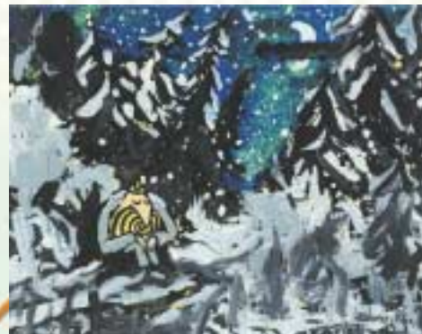
Capitaine Lonchamps ©