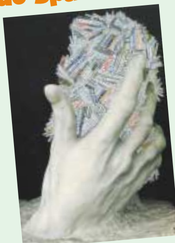
André Stas ©