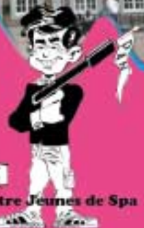
Centre Jeunes de Spa

Rue de la Geronstère, 10 B 4900 - Spa Tél. : 087.77.45.65