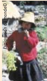
Exploration du monde©

Jeudi 26 janvier 2006 - Exploration du Monde - " Pérou - à la découverte des cités perdues " par Josée Gaudreau - 20h15 - Petit Théâtre du Casino de Spa - Info : Échevinat de la Culture 087.79.53.73