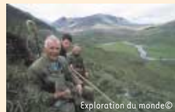
Exploration du monde©

Jeudi 23 février 2006 - Exploration du Monde " Etats-Unis-les derniers mondes sauvages " par Eric Courtade - 20h15 - Petit Théâtre du Casino de Spa - Info : Échevinat de la Culture 087.79.53.73