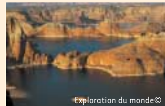
Exploration du monde©

Dimanche 5 février 2006 - " Un livre, un auteur " par Elisa Brune - 14h00 Info : Bibliothèque de Spa 087.77.24.52