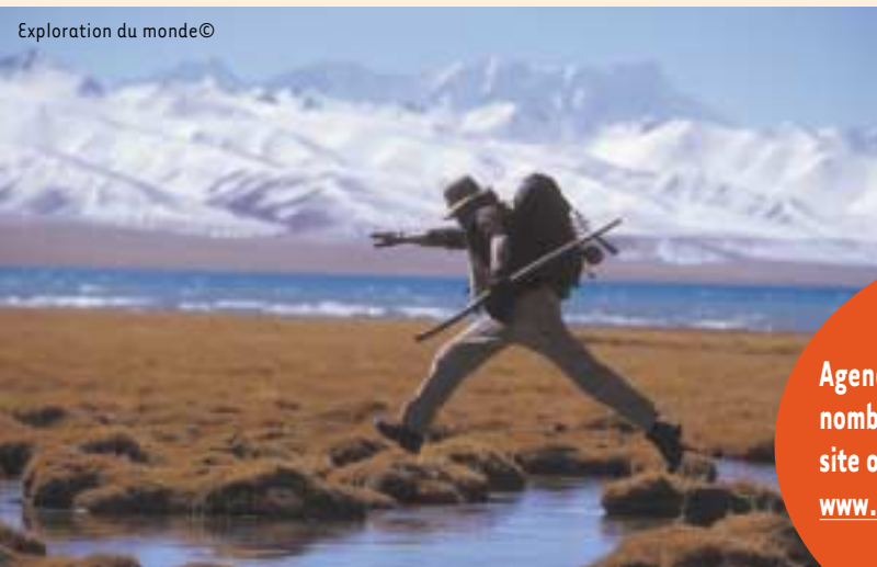
Exploration du monde©

Jeudi 24 novembre 2005 - Exploration du Monde - " De la Sibérie à l'Inde, le chemin de la liberté " par Sylvain Tesson- 20h15 - Petit Théâtre du Casino de Spa Info : Échevinat de la Culture 087.79.53.73