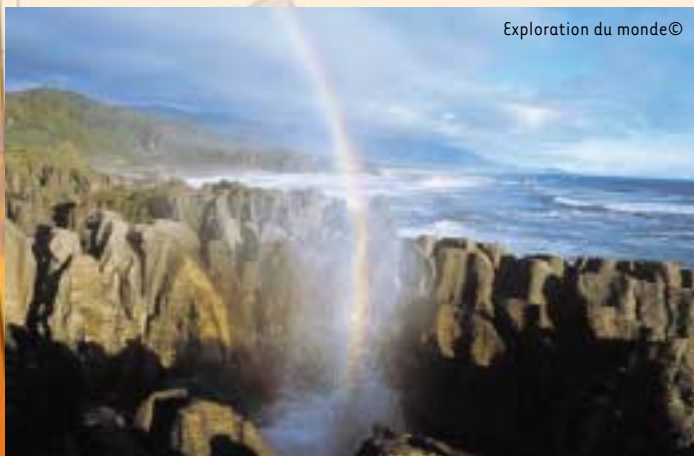
Exploration du monde©

Samedi 22 octobre - La Petite Bande - " Les quatre saisons " de Vivaldi - Automne Musical - 20h15 - Casino de Spa Info : Office du Tourisme 087.79.53.53