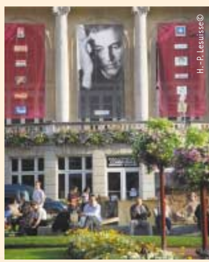
H. - P. Lesuisse©